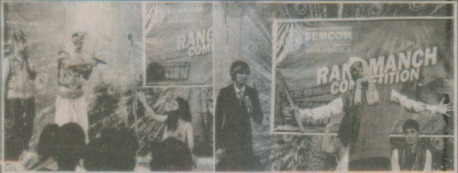
સેમકોમ કોલેજના વિદ્યાર્થીઓ રંગમંચ કાર્યક્રમ રજૂ કરતા નજરે પડે છે.